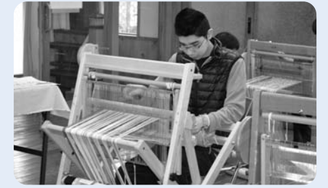
▲月1回道の駅でコミュニティ Olive を開催