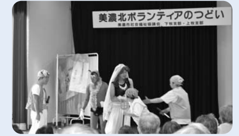
▲職員による寸劇「アラジンと魔法のランプ」